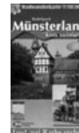
Steinfurt (1:50.000) 6,80 €