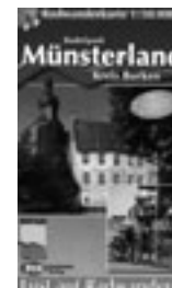
Borken (1:50.000) 6,80 €