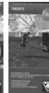
Twente (1:50.000) 7,95 €