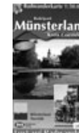
Coesfeld (1:50.000) 6,80 €