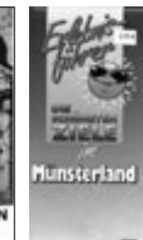
Erlebnisführer (1:145.000) 2,95 €