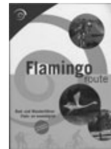
Flamingo Route Begleitbuch mit Karte (1:50.000) 9,80 €