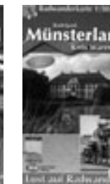
Warendorf (1:50.000) 6,80 €