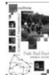
agri-cultura Begleitbuch mit Karte (1:50.000) 7,80 €