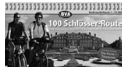
100 Schlösser-Route (1:75.000) 9,95 €