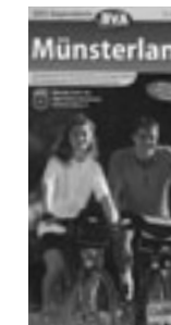
Münsterland (1:75.000) 6,80 €