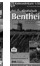
Bentheim (1:50.000) 7,95 €