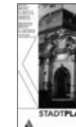
Stadtplan (1:20.000) 2,00 €