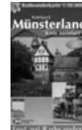
Steinfurt (1:50.000) 6,80 €