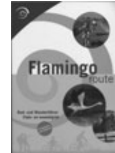
Flamingo Route Begleitbuch mit Karte (1:50.000) 9,80 €