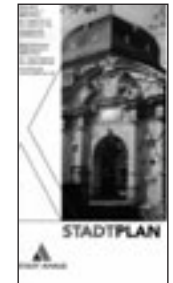
Stadtplan (1:20.000) 2,00 €