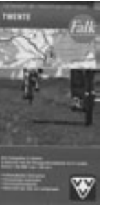
Twente (1:50.000) 7,95 €