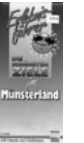
Erlebnisführer (1:145.000) 2,95 €