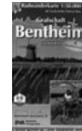
Bentheim (1:50.000) 7,95 €