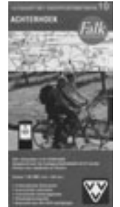
Achterhoek (1:50.000) 7,95 €