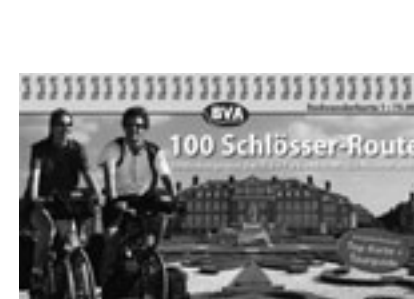
100 Schlösser-Route (1:75.000) 9,95 €