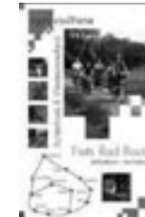
agri-cultura Begleitbuch mit Karte (1:50.000) 7,80 €