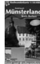
Borken (1:50.000) 6,80 €