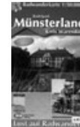
Warendorf (1:50.000) 6,80 €