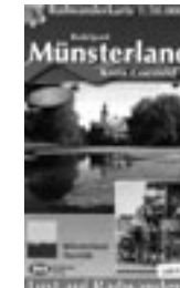
Coesfeld (1:50.000) 6,80 €