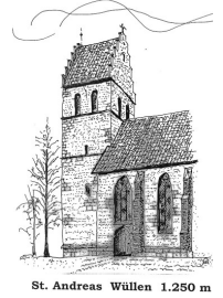
St. Andreas Wüllen 1.250 m